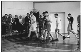
Halowy Street Basket :)

Mecze siatkówki plażowej nie zostały co prawda rozegrane na piasku, ale na trawie. Mimo to zgromadziły one spórą liczbę zawodników i kibiców. Żaden zespół nie poradził sobie z niepokonaną drużyną AZSu „Legnica”, która zepchnęła na drugą pozycję „What s up”, a na trzecią „Porębiaków”.