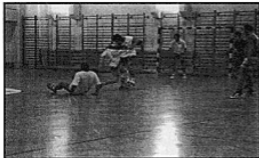
NZS w akcji