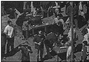
Kwatera główna klubu Bojer

Muzyka z klubu Bojer umilała wszystkim życie, jednak atmosfera nie była jeszcze luźna. Pierwsza próba złuzowania: konkurs na najbardziej rozkrzyżowaną ekipę przy grillu. Wynik???? - jednak ludzie chcą się bawić. Mieszana drużyna; trzecie piętro z T15 i inni z zewnątrz wygrali ten konkurs bezapelacyjnie. No i wtedy się ruszyło, wszyscy zaczęli szaleć, skakać, krzyczeć; tak zostało do końca. Była cała masa różnych konkursów: na najsmaczniejszą kiełbasę dla rektora, na najbardziej wesołą drużynę (wygrała ekipa która dostarczyła po