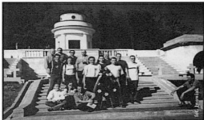
Grupa z NZS-u na cmentarzu we Lwowie

Kierownik Samodzielnej Sekcji Sprawy Studenckich (Koordynator sekcji grupy wrocławskiej)