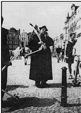
Skóra, fura i komóra

Odbył się też pokaz w wykonaniu Zawodowców, którzy uczestniczyli wcześniej w zawodach rangi ogólnopolskiej zdobywając niejednokrotnie wysokie pozycje.