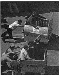
Wyciąg w śmietnikach

Muzyka z klubu Bojer umilała wszystkim życie, jednak atmosfera nie była jeszcze luźna. Pierwsza próba złuzowania: konkurs na najbardziej rozkrzyżowaną ekipę przy grillu. Wynik???? - jednak ludzie chcą się bawić. Mieszana drużyna; trzecie piętro z T15 i inni z zewnątrz wygrali ten konkurs bezapelacyjnie. No i wtedy się ruszyło, wszyscy zaczęli szaleć, skakać, krzyczeć; tak zostało do końca. Była cała masa różnych konkursów: na najsmaczniejszą kiełbasę dla rektora, na najbardziej wesołą drużynę (wygrała ekipa która dostarczyła po