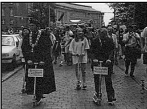
Rektorzy w drodze na rynek