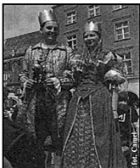
Król i Królowa Juwenaliów