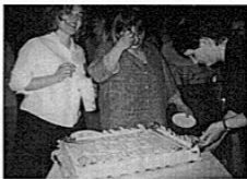
Tort urodzinowy AEGEE - Wrocław

I nadeszła niedziela, ciężko było wstać, ale wizja wycieczki do Książa dodała nam sił. Podczas podróży Big Brother Green miał zadanie dla uczestników: mieli ułożyć piosenkę. Nagrodą był zielony dolar za słuchaną szybka, zwyciężyła antena z Gliwic (wtajemniczeni wiedzą, dlaczego). I tak śpiewający autokar dotarł na miej-