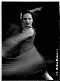
fol. Michał Dulemba

bu pod Kolumnami gdzie od 0705.01 możemy zapoznać się z ciekawym fotograficznym dokumentem pt. „Olbin-na-sza” autorstwa Marcina Osmana.