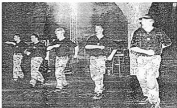
Jeszcze... po raz pierwszy i ostatni w naszej gazecie.