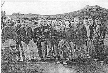
Członkowie NZS (Rajd Ekologiczny Szrenica 99).

NZS działa jako organizacja oficjalnie zarejestrowana na Politechnice Wrocławskiej od chwili jej reaktywowania w kwietniu 1998 roku przez grupę studentów Wydziałów Elektroniki oraz Mechanicznego. Obecnie zrzeszenie ma już wla-